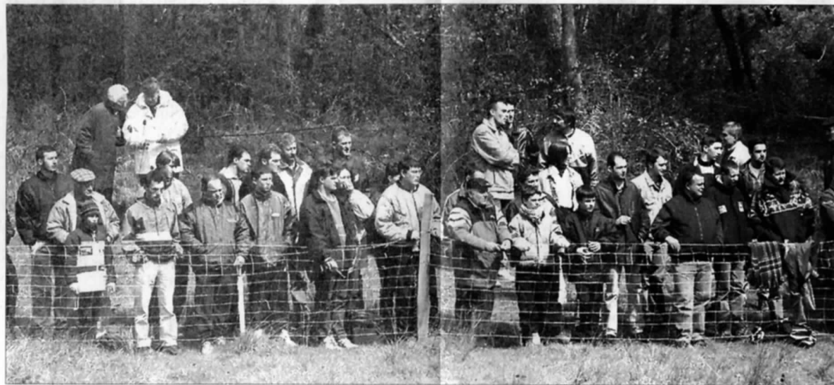
Un nombreux public se pressait sur les bords de la route

veux avant de laisser la route de Saint-Pierre-Eynac et prendre